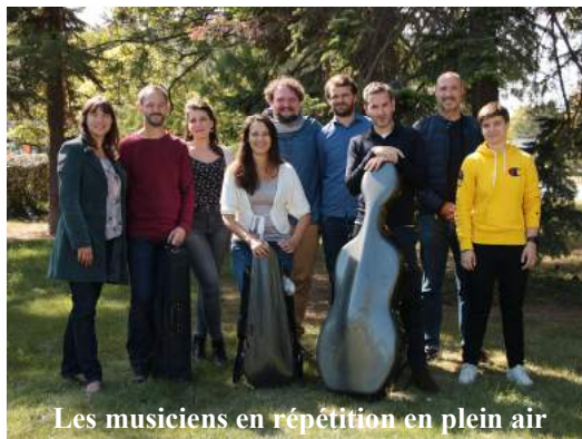
Les musiciens en répétition en plein air