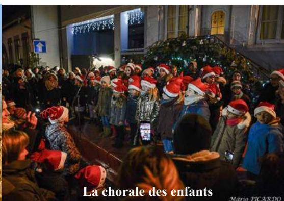
La chorale des enfants