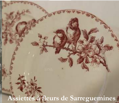
Assiettes à fleurs de Sarreguemines