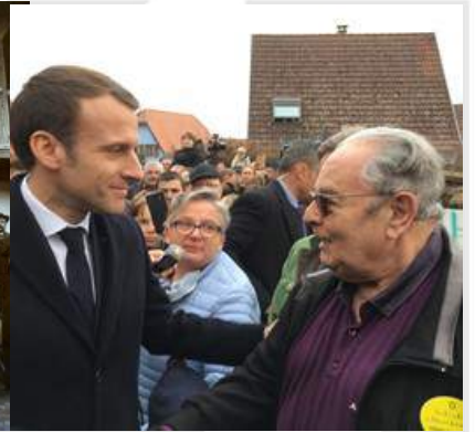
Cérémonie du 3 mars 2019 au cimetière juif de Quatzenheim