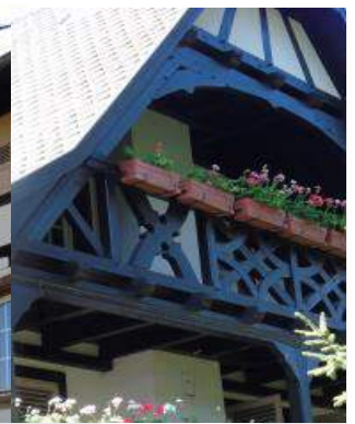
Le moulin de Quatzenheim à colombages situé derrière l'église (aujourd'hui propriété de la famille Hoffmann) Le fossé de l'ancien château se trouvait sur ce tracé.