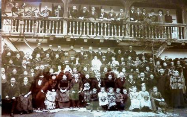
Mariage en 1900 à la ferme Freysz avec les cuisinières juives à droite, embauchées spécialement