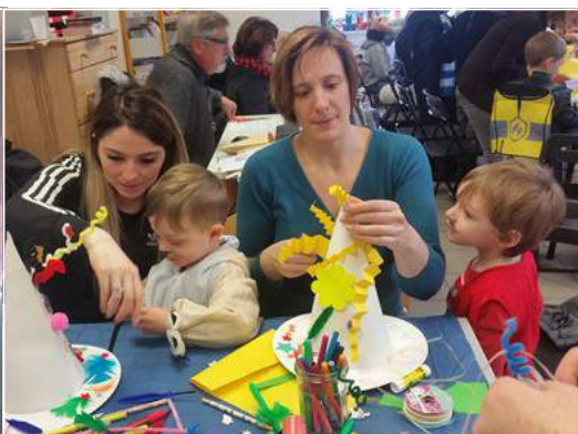
Atelier Chapeaux de carnaval à la Bibliothèque