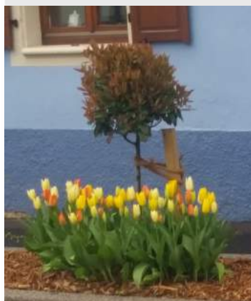
La photo du mois Printemps dans les massifs

Je vous souhaite un bel été au sein de notre village ou ailleurs et que chaque jour soit riche en rencontres et en découvertes.