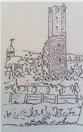
La tour du château médiéval de Quatzenheim derrière l'église vers le moulin

À la fin du 19ème siècle existait encore une tour ronde et en 1836 le puits du château était toujours là. L'ancien Moulin de Quatzenheim est bien visible en passant par le pont de la Souffel, niché dans la verdure. Une famille autrichienne vint s'établir à Quatzenheim en achetant la charge de meunier au châtelain dans la seconde moitié du 17ème siècle. Entre 1660 et 1880, l'entreprise tournait très bien avec une vingtaine de journaliers !