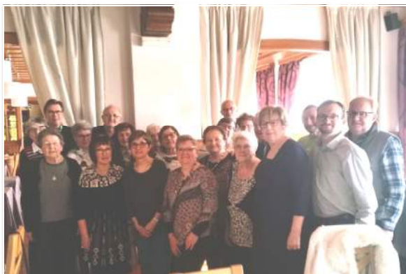
Assemblée Générale des Hirdelles A Scharrachbergheim